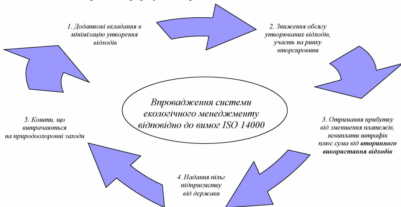
Рис. 7.1. Реалізація положень міжнародних стандартів ISO 14000 у системі забезпечення РЕБ (складено автором)

здійснюватися в рамках формування регіональної політики РЕБ.