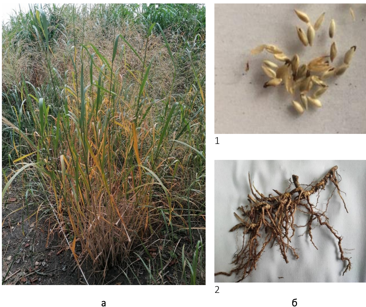
Рис. 1. Просо прутоподібне: а – рослина, б – органи розмноження: 1 – насіння, 2 – ризоми

З метою визначення оптимальних агротехнологічних прийомів для підвищення врожайності та якості насіння Panicum virgatum L. в умовах центрального Лісостепу України було проведено експеримент. Дослідження здійснювали протягом 2021–2023 років з використанням методики польового дослідження в агрономії та відповідних науково-методичні рекомендації [7–9].