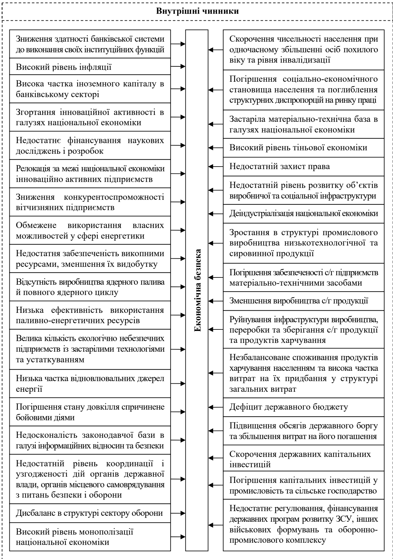
Рис. 3. Основні внутрішні чинники загроз економічній безпеці України