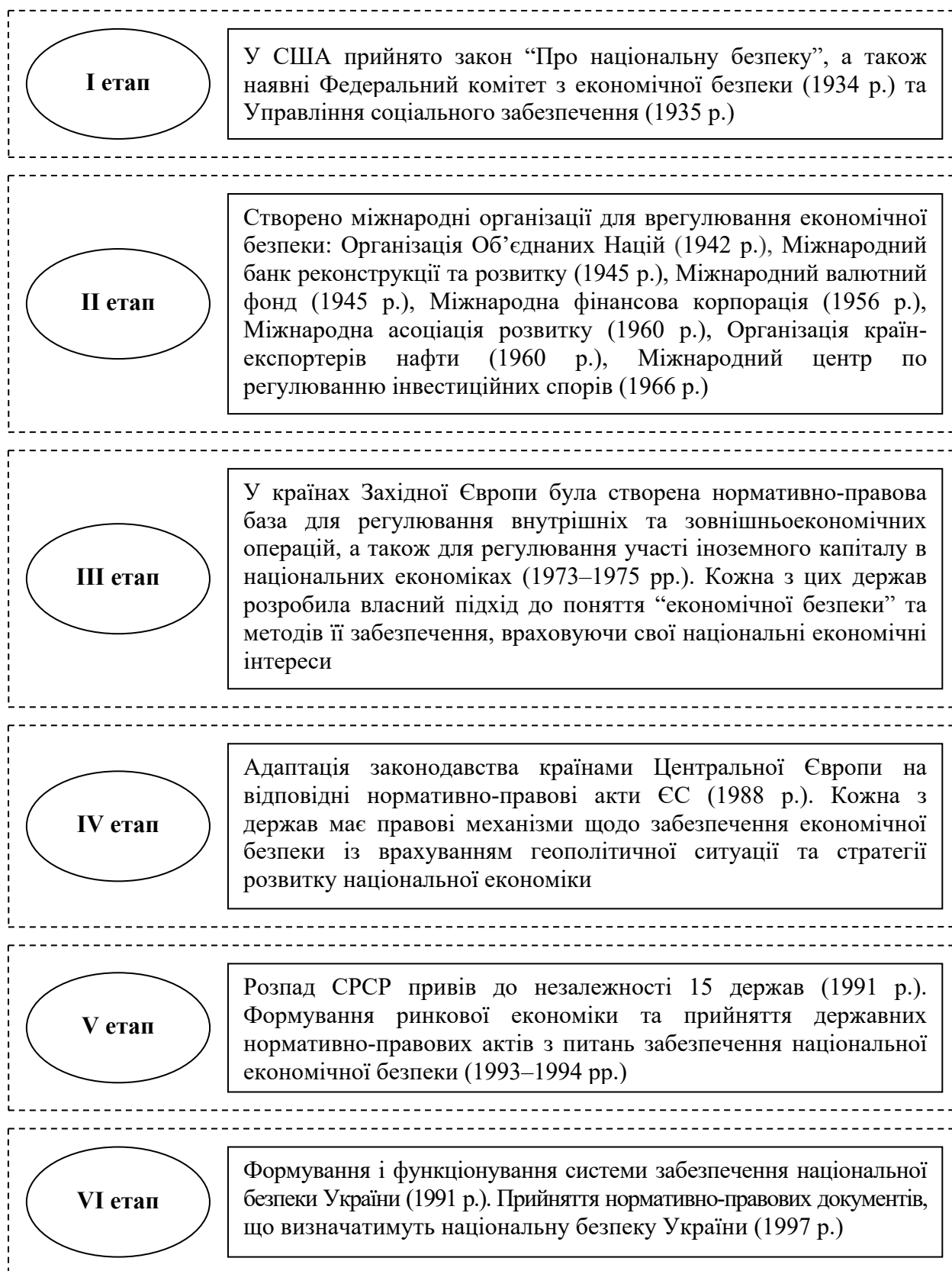
Рис. 1. Етапи розвитку категорії економічна безпека