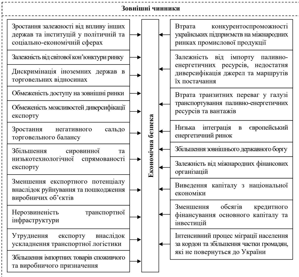
Рис. 2. Основні зовнішні чинники загроз економічній безпеці України