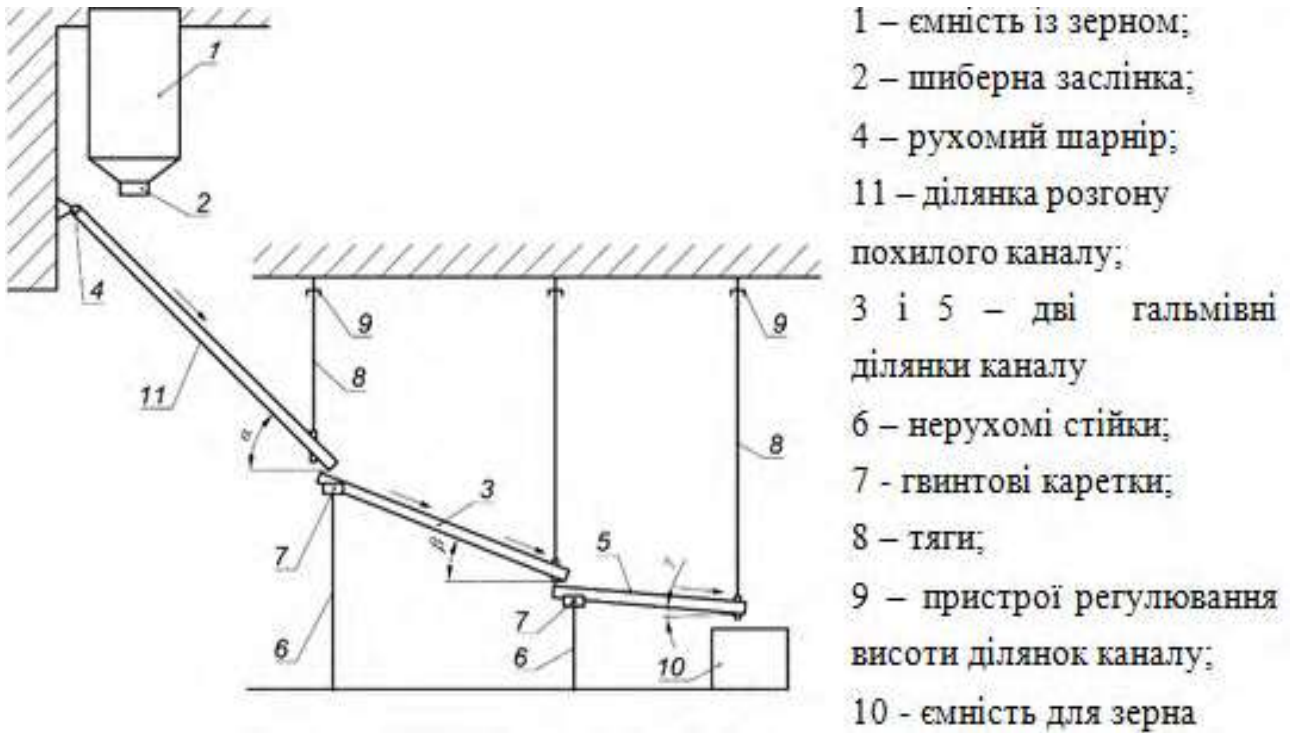
Рис. 1. Гравітаційна установка прямого каналу з трьома ділянками що складається з трьох ділянок зі змінними кутами нахилу.

Окремо досліджено контрольований рух зерна у периферійному гвинтовому каналі з двома змінними кутами нахилу (рис. 2) та рух зернової маси по чотирьом регульованим полицям пересипної каскадної установки (рис. 3).