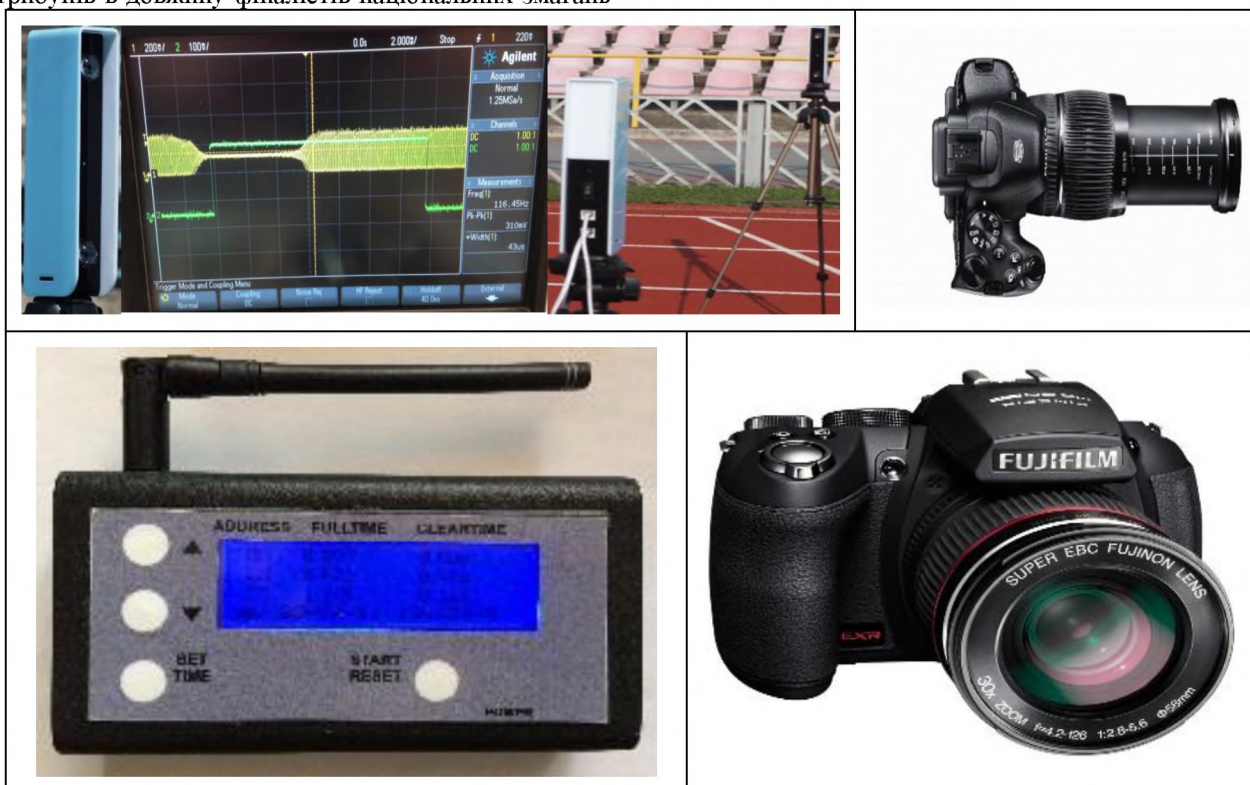
Рис. 1. Електронно-оптична система «старт-фініш» (час затримки вихідного сигналу від моменту перетинання променю – менш ніж 0,001с); цифрова фотокамера Fine-Pix HS20EXR

Методи дослідження. Реєстрація часових кінематичних характеристик техніки стрибків в умовах змагання проводилася за допомогою електронно-оптичної системи «Старт-фініш»: фіксувався час подолання останніх двох 5-метрових ділянок перед відштовхуванням (10-5 м і 5-0 м). Результати вимірів за допомогою радіоканального зв'язку поступали і архівувалися в електрохронометрі (рис. 1). Ці результати потім уточнювалися стосовно розрахункових показників, отриманих комп'ютерною біомеханічно-технологічною системою «OptoJump» [5, 10]. Кутові просторові і просторово-часові кінематичні показники змагальної діяльності кваліфікованих стрибунів, такі як довжина горизонтальної проєкції переміщення ЗЦМТ стрибунів в процесі відштовхування, кут вильоту, початкова швидкість вильоту і максимальна висота підйому центру мас спортсмена в польотній фазі були отримані за допомогою швидкісної цифрової відеозйомки (фотокамера «FinePix HS20EXR») і оброблені в комп'ютерній програмі відеоаналізу «Kinovea» та графічного редактора «Corel-DRAW» (див. рис. 1).