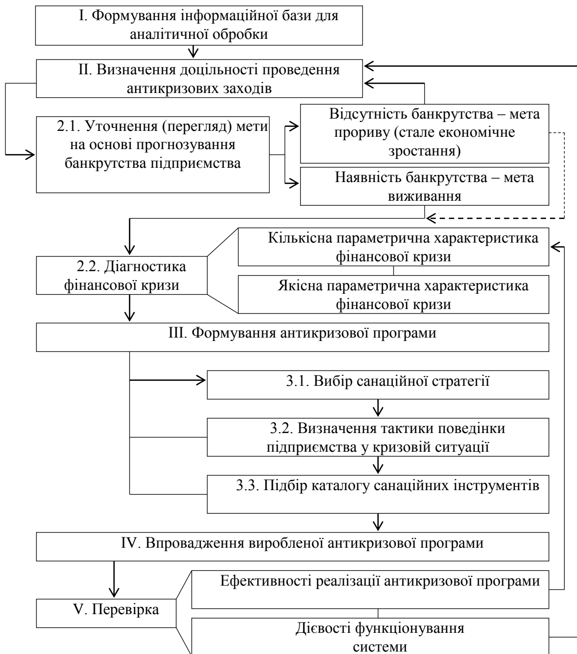
Рис. 2. Реалізація системи раннього виявлення та подолання фінансової кризи

Загальна послідовність реалізації системи раннього виявлення та подолання фінансової кризи має охоплювати всі її функціональні етапи (рис. 2).