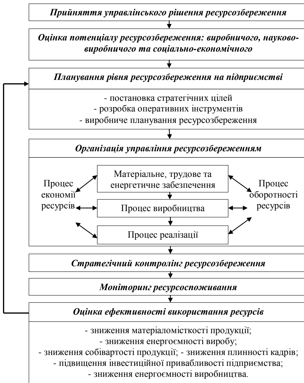
Рис. 1. Система ефективного ресурсозбереження аграрного підприємства [3]

найважливіших глобальних проблем сучасного аграрного підприємства, яку можливо вирішити шляхом ресурсозбереження та енергозбереження [3].