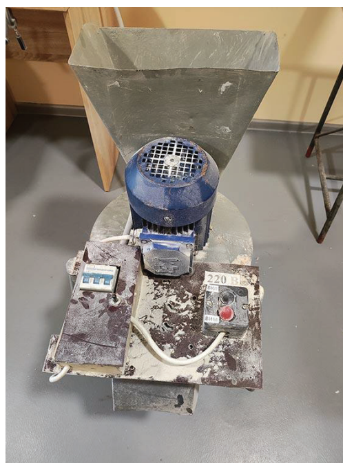
Рис. 1 – Дробарка молоткова

Розроблена конструкція молоткової дробарки ДМ-360 призначена для подрібнення різних видів сировини, відзначається простотою будови, зручністю експлуатації та технічного обслуговування (рис. 1, табл. 4) [4]. Її характерною особливістю є можливість швидкої заміни найбільш зношуваних елементів, зокрема деки, молотків, решета.