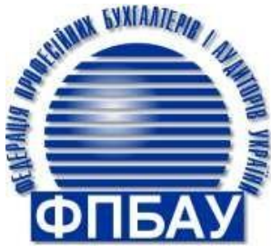
Федерація професійних та фінансів бухгалтерів та аудиторів України

МІНІСТЕРСТВО ОСВІТИ І НАУКИ УКРАЇНИ ПОЛТАВСЬКА ДЕРЖАВНА АГРАРНА АКАДЕМІЯ ДВНЗ «ПЕРЕЯСЛАВ-ХМЕЛЬНИЦЬКИЙ ДЕРЖАВНИЙ ПЕДАГОГІЧНИЙ УНІВЕРСИТЕТ ІМЕНІ ГРИГОРІЯ СКОВОРОДИ» НАЦІОНАЛЬНИЙ НАУКОВИЙ ЦЕНТР «ІНСТИТУТ АГРАРНОЇ ЕКОНОМІКИ» УКРАЇНСЬКА НАЦІОНАЛЬНА АКАДЕМІЯ АГРАРНИХ НАУК ФЕДЕРАЦІЯ АУДИТОРІВ, БУХГАЛТЕРІВ І ФІНАНСИСТІВ АПК УКРАЇНИ НАЦІОНАЛЬНА МЕТАЛУРГІЙНА АКАДЕМІЯ УКРАЇНИ СУМСЬКИЙ НАЦІОНАЛЬНИЙ АГРАРНИЙ УНІВЕРСИТЕТ ХАРКІВСЬКИЙ НАЦІОНАЛЬНИЙ ТЕХНІЧНИЙ УНІВЕРСИТЕТ СІЛЬСЬКОГО ГОСПОДАРСТВА ІМЕНІ ПЕТРА ВАСИЛЕНКА ХАРКІВСЬКИЙ ДЕРЖАВНИЙ УНІВЕРСИТЕТ ХАРЧУВАННЯ ТА ТОРГІВЛІ ДВНЗ «ХЕРСОНСЬКИЙ ДЕРЖАВНИЙ АГРАРНО-ЕКОНОМІЧНИЙ УНІВЕРСИТЕТ» ТОВ «БЕРДЯНСЬКИЙ УНІВЕРСИТЕТ МЕНЕДЖМЕНТУ І БІЗНЕСУ»