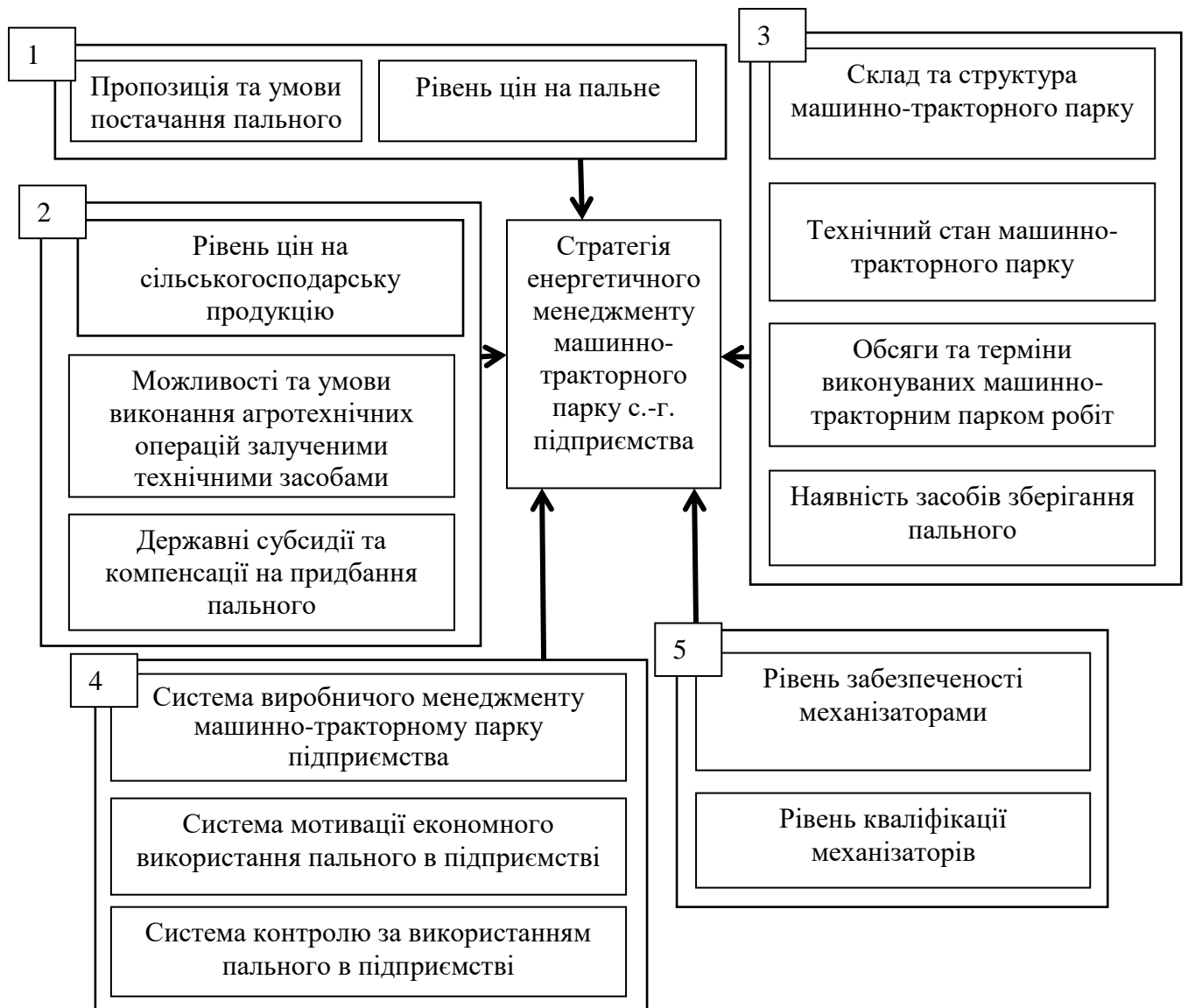
Рис. 1 Чинники, що впливають на формування та реалізацію стратегії енергетичного менеджменту машинно-тракторного парку сільськогосподарського підприємства

Умовні позначення: 1) чинники зовнішнього середовища прямого впливу, 2) чинники зовнішнього середовища непрямого впливу, 3) техніко-технологічні чинники внутрішнього середовища, 4) організаційно-управлінські чинники внутрішнього середовища, 5) експлуатаційні чинники внутрішнього середовища.