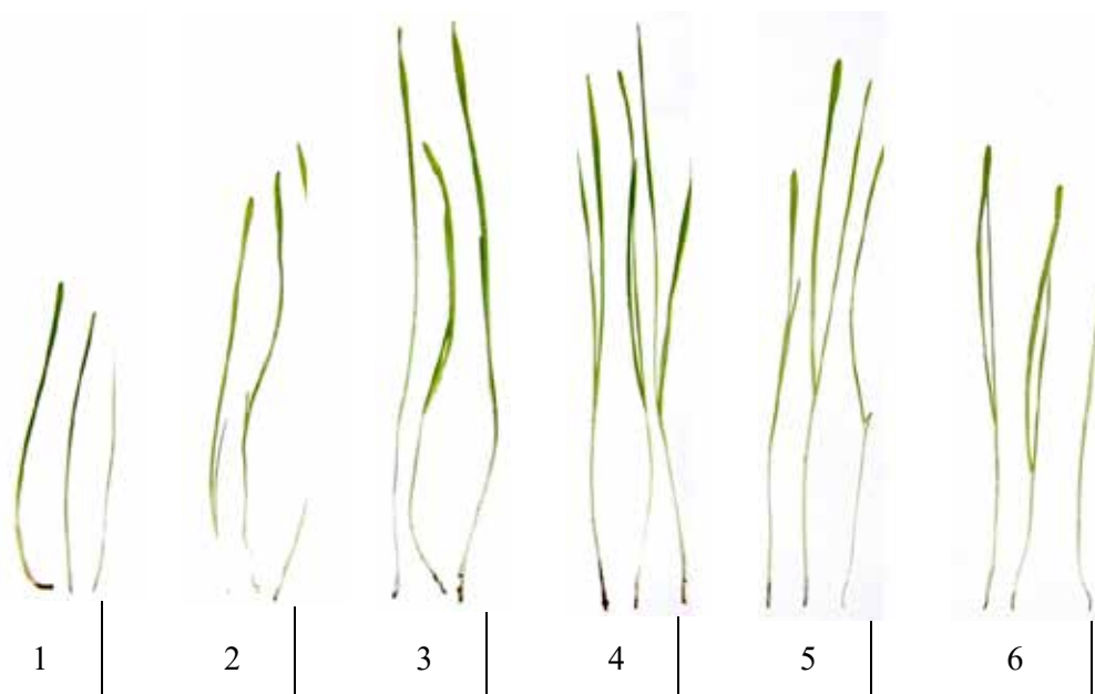
Рис. 1. Дослідні рослини під час проведення дослідів з прямого біотестування

На рисунку 2 представлені результати вивчення активності каталази в ґрунті при повторному вирощуванні ехінацеї бідої. Отримані дані дозволяють зробити висновок про більш високу каталазну активність ґрунту при вирощуванні ехінацеї порівняно із контролем, що свідчить про позитивну