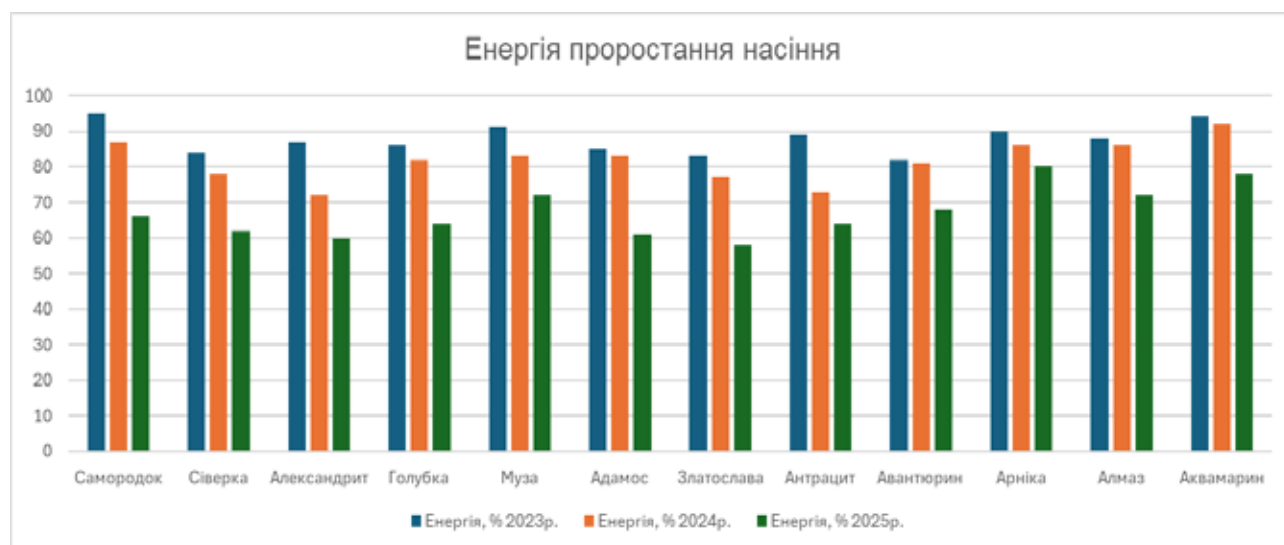
Рис. 2. Енергія проростання насіння сої за роками зберігання

загальної кількості сортів, включених у дослідження, продемонстрували схожість на рівні вимог ДСТУ 2240–93 (Алмаз, Аквамарин, Арніка, Муза і Самородок). Таким чином, ці сорти виявилися більш придатними для зберігання протягом тривалого періоду.