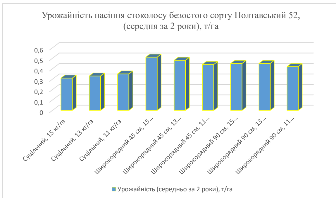
Рис.3 Урожайність насіння стоколосу безостого сорту Полтавський 52 в залежності від норми висіву та способу посіву, (середня за 2 роки), т/га HP_{05} , т/га -0,005

Загалом, аналіз показує, що максимальна урожайність досягається при нормах висіву 13-15 кг/га та ширині міжряддя 45 см, що забезпечує баланс між густиною посівів і доступністю ресурсів для формування високих врожаїв (рис.3).