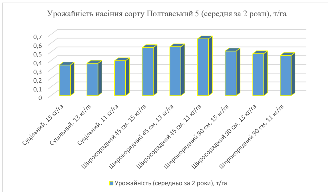
Рис.4 Урожайність насіння стоколосу безостого сорту Полтавський 5 в залежності від норми висіву та способу посіву, (середня за 2 роки), т/га HP_{05} , т/га -0,006

Загалом, результати підтверджують, що широкорядний спосіб сівби з міжряддям 45 см та нормою висіву 13-15 кг/га забезпечує найвищу урожайність і є більш ефективним з точки зору врожайності, в порівнянні з суцільним посівом. Це обґрунтовано покращеним освітленням та вентиляцією рослин, а також більш рівномірним розвитком генеративних пагонів (рис.4).