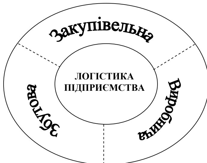
Рис. 1. Основні функціональні сфери логістики на підприємстві

жному з них [11]. Наприклад, визначаючи оптимальні обсяги закупівлі необхідної сировини, її якісні характеристики та термін здійснення цих закупівель, виходять з виробничих можливостей підприємства, особливостей його господарювання та стратегії розвитку. Остання, у свою чергу, певною мірою обумовлюється потребами споживачів, узгодження з якими асортименту та номенклатури продукції оптимізує виробничу та покращує збутову діяльність.