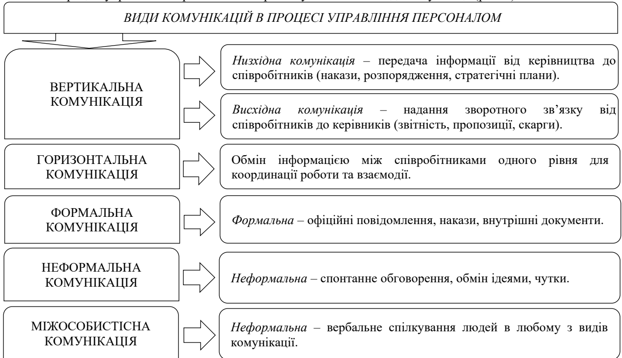
Рис. 1. Види комунікацій в процесі управління персоналом [узагальнено за допомогою 3]

В процесі управління персоналом використовують основні види комунікації (рис. 1).