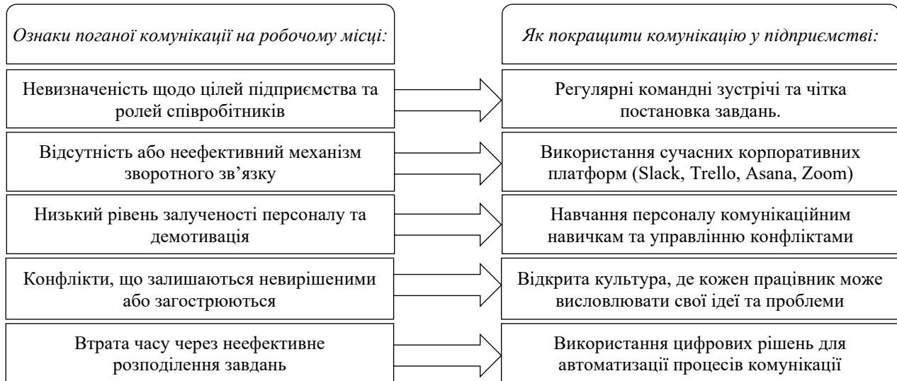
Рис. 2. Ознаки поганої комунікації на робочому місці та способи її покращення

Розглянемо ознаки поганої комунікації на робочому місці та напрями її покращення (рис. 2).