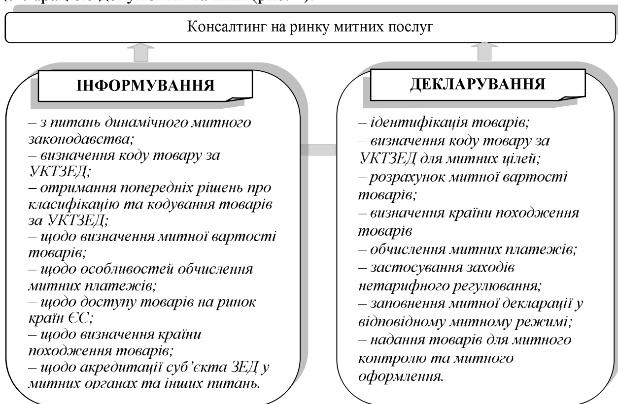
Рисунок 2 – Система послуг митного брокера

У сучасних умовах, що супроводжуються формуванням нових напрямків зовнішньоторговельного співробітництва, вдосконалення послуг в митній сфері є одним з найбільш актуальних питань розвитку зовнішньоекономічної діяльності вітчизняних підприємств. Аналізуючи комплекс надаваних митним брокером послуг, відзначимо, що найбільш поширеними є: класифікація товару для митних цілей, визначення митного режиму, обчислення митної вартості та митних платежів, заповнення митної декларації та взаємозв'язаних з декларацією документів та інші (рис. 2).