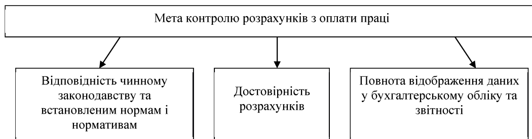
Рис. 1. Мета контролю розрахунків з оплати праці