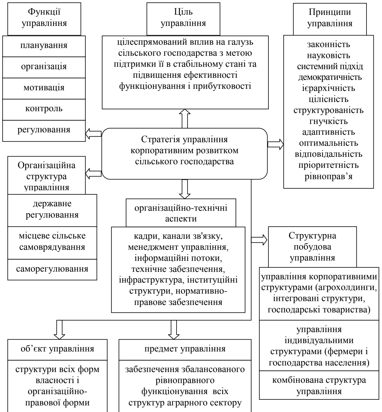
Рис. 1. Концепція побудови системи управління корпоративними відносинами в агросфері

системи заходів захисту товаровиробників від ризиків та страхування збитків аграрного виробництва; значні коливання цін на сільськогосподарську продукцію у зв'язку з різними рівнями врожайності, амплітудою кон'юнктури аграрного ринку; споживчі властивості продукції, що виробляється; низьку інвестиційну привабливість галузі через тривалий цикл виробництва, високий ступінь непередбачуваності і ризиків, низьку рентабельність певних видів діяльності; необхідність значних фінансових інвестицій для технічного оснащення галузі; високу залежність кінцевих результатів від міжгалузевих зв'язків.