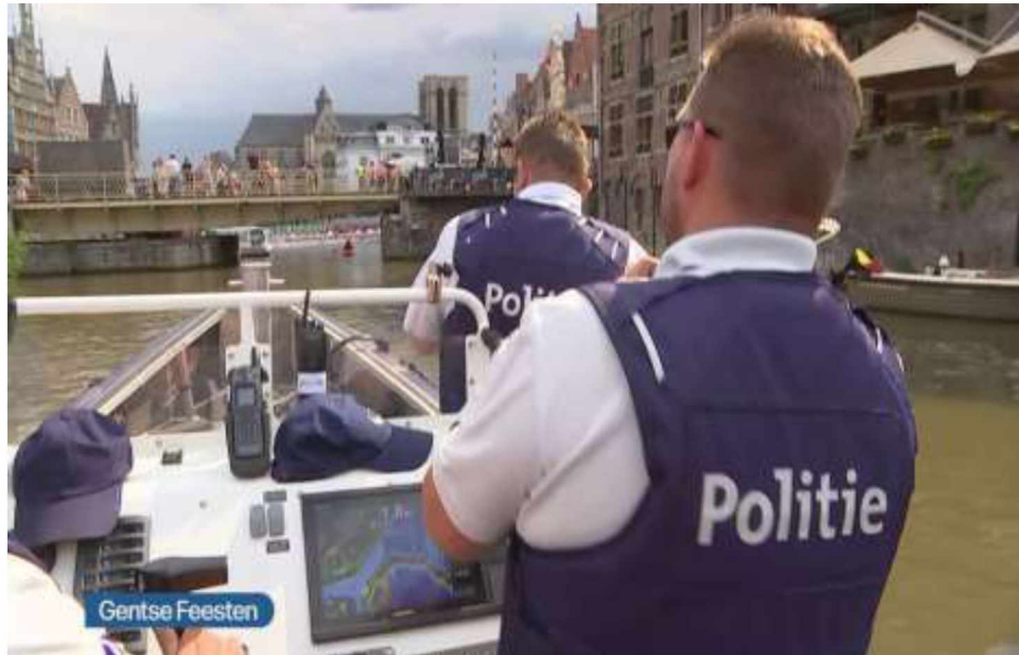
Рис. 4. Плавзасоби для виконання завдань водних підрозділів Королівства Бельгія