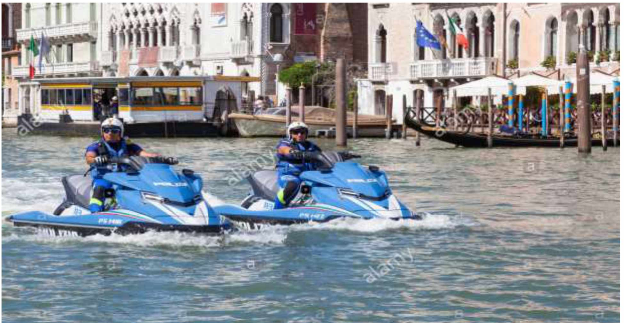
Рис.7. Плавзасоби для виконання завдань водних підрозділів Італії

Морська поліція як структурний підрозділ державної поліції Італії, діяльність якого спрямована на забезпечення мирного і впорядкованого, а також безпечного здійснення діяльності в портових, державних і територіальних морських районах: патрулювання водних територій; контроль за виконанням законів про рибальство; протидія забрудненню суднами води; виконання правил переміщення судів в портових зонах; протидія екологічним злочинам; превентивні заходи на воді; взаємодія з керівниками портових установ тощо.