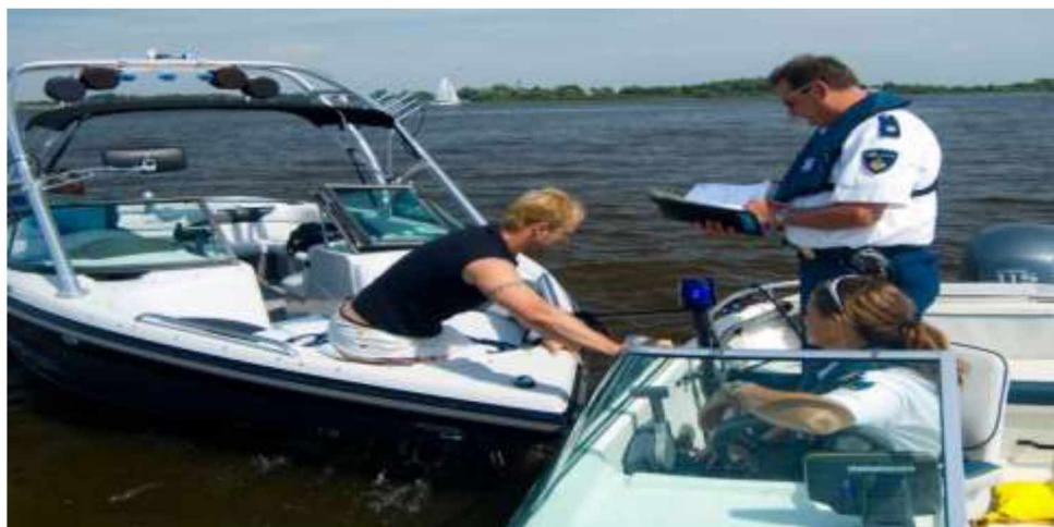
Рис. 6. Плавзасоби для виконання завдань водних підрозділів Нідерландів

Підрозділ водної поліції контролює комерційні та прогулянкові судна, головним чином на артеріальних водах і великих просторах відкритих вод. Також, підрозділ надає допомогу у випадку аварій і розслідують зіткнення, інші види нещасних випадків і екологічні правопорушення. Підрозділ діє вздовж узбережжя та у прибережних водах шляхом надання допомоги та аварійних служб у Північному морі.