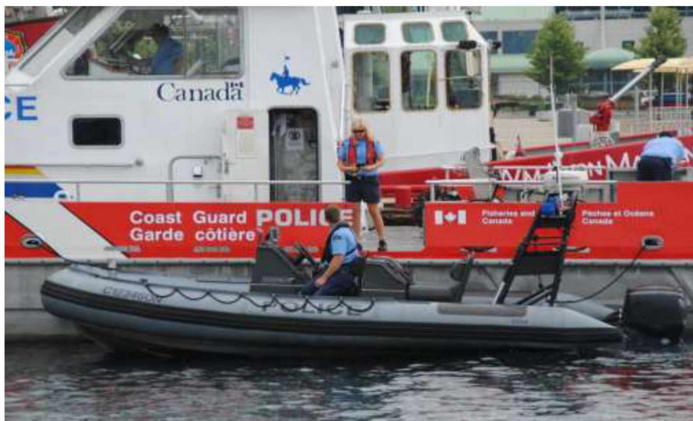
Рис. 5. Плавзасоби для виконання завдань водних підрозділів Канади

Підрозділи RCMP експлуатують майже 400 плавзасобів, з яких 5 спеціальних швидкісних патрульних суден (до 19,8 м), 377 плавзасобів різного розміру, як середні (до 12 метрів) та маломірні (до 6 метрів) надувні човни з жорстким корпусом типу RIB, а також каное.