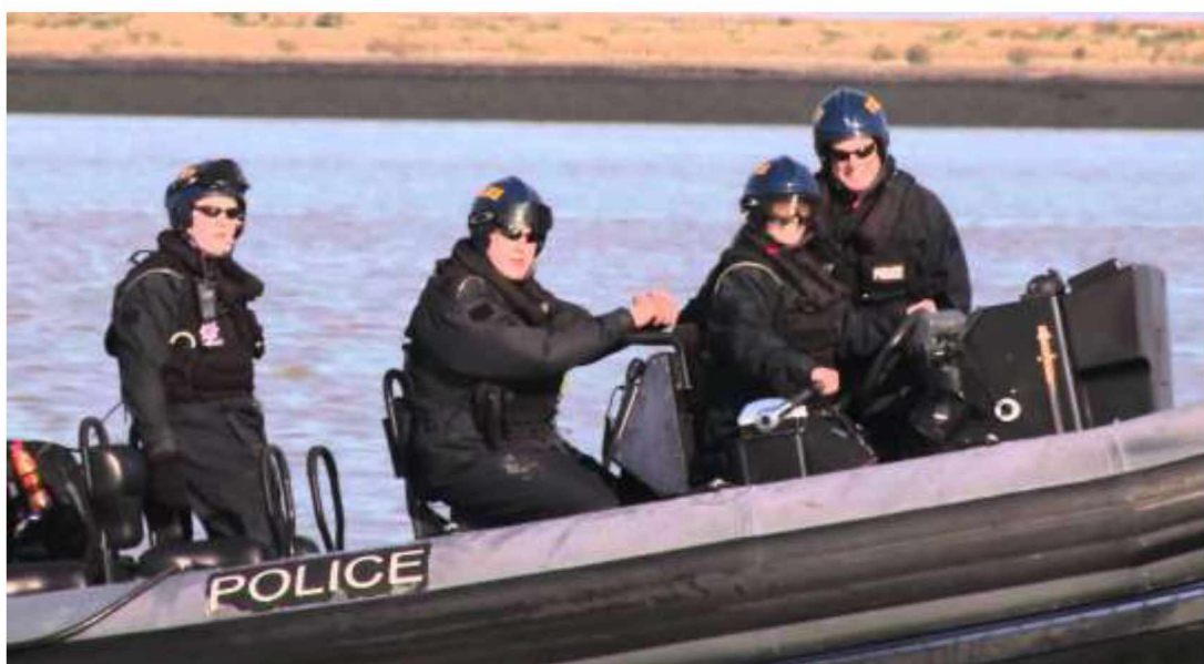
Рис.8. Плавзасоби для виконання завдань водних підрозділів Великої Британії

Морський підрозділ поліції Великої Британії, котрий здійснює: пошук і порятунок осіб; проводить підводні роботи у водоймах, у тому числі пошук в обмеженому просторі (каналізація, тощо); патрулювання прибрежних територій в морі (до 12 морських миль у море); відпрацювання берегової лінії; надання допомоги постраждалим під час повені; співпраця з іншими правоохоронними органами Анлії (митні оргнами, Міграційна служба, Королівський флот); протидія наркозлочинності (обшук суден) тощо.