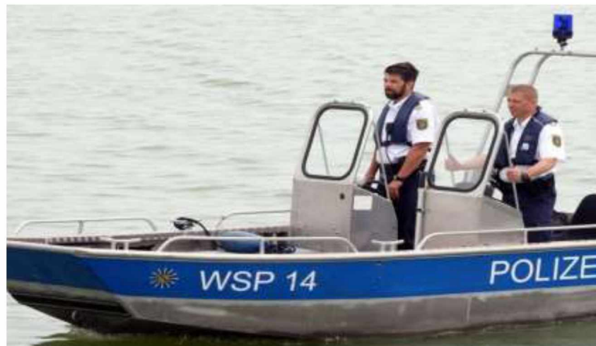
Рис. 1. Плавзасоби для виконання завдань в територіальних та міжнародних водах ФРН

Для виконання завдань в територіальних та міжнародних водах підрозділи поліції на воді використовують плавзасобів різного класу, зокрема великі патрульні судна, середні та малі патрульні катери, катери типу «RIB», буксири та гідроцикли.