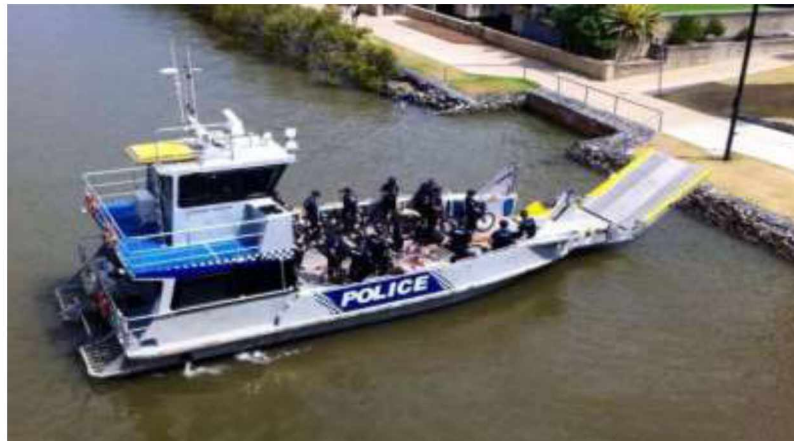
Рис. 3. Плавзасоби для виконання завдань водних підрозділів Австралії.

Підрозділи МАС експлуатують спеціально розроблені для поліції 23-метрові патрульні судна, спеціалізовані пошукові судна із сучасним навігаційним, комунікаційним та пошуковим обладнанням. Водночас найбільшу частину поліцейських плавзасобів складають середні (до 12 метрів) та маломірні (до 6 метрів) надувні човни з жорстким корпусом типу RIB, а також гідроцикли.