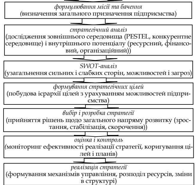
Рис. 2. Процес стратегічного управління розвитком підприємства. Джерело: [5; 11]

Роль стратегії як інструменту управління проявляється через такі ключові функції: