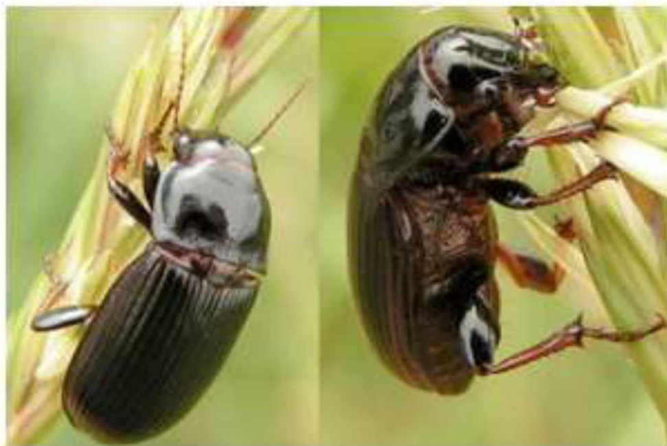
Рис.2.1 Хлібний турун ( Zarbus tenebrioides Goeze.)

Хлібний турун ( Zarbus tenebrioides Goeze.) належить до ряду твердокрилих ( Coleoptera ), родини туруни ( Carabidae ) – поширений в Степу і Лісостепу аж до південної межі Полісся (Рис.2.1).