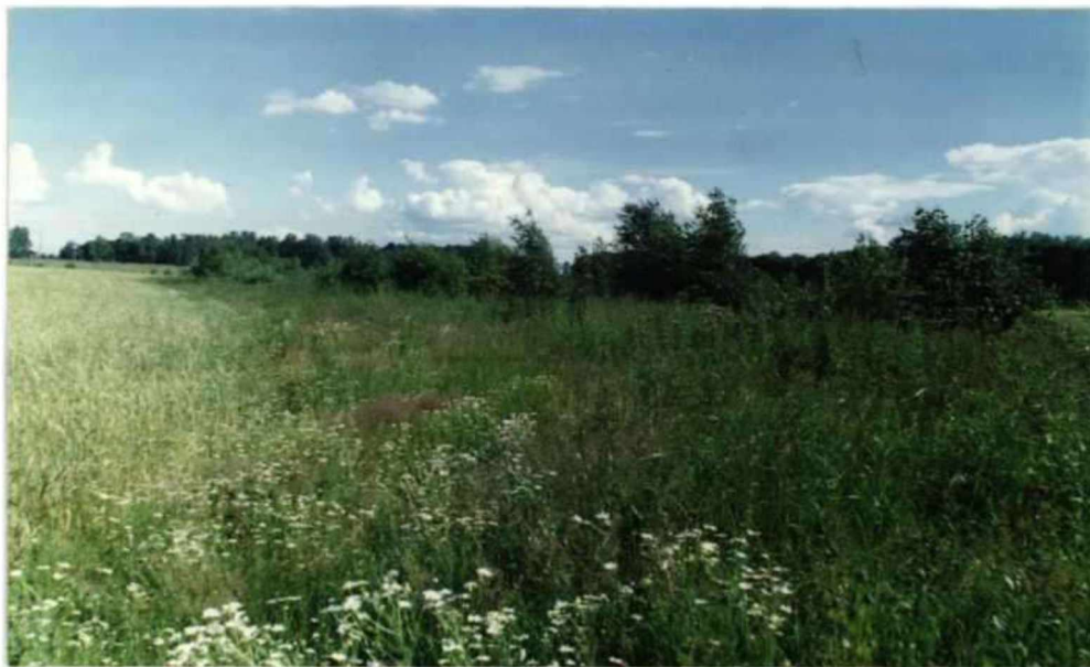
Рис.3.1. Дослідне поле 1. Західне узбіччя з ловильними пастками (Кобеляцький р-н с. Лучки)

дозволяє вирощувати майже всі сільськогосподарські культури, але при умові дотримання всіх агротехнічних заходів. В свою чергу успішність їх застосування залежить від того, як здійснюється система заходів по захисту рослин від хвороб і шкідників. Тому що робота саме в цьому напрямку може дати бажані результати в питанні підвищення врожайності сільськогосподарських культур, в першу чергу провідної зернової культури Полтавської області – озимої пшениці, яка в структурі всіх посівів складає 23%, а в структурі зернових області – близько 50% [8]. Поле №1, де обліки проведені в 2020 році, з трьох боків оточене меліоративними канавами, порослими високою різнотрав'ям. Узбіччя в західній частині поля - це смуга різнотрав'я шириною 1,5-2 м, що межує з канавами, де виростили тонконіг, полин звичайний, звіробій звичайний, осот польовий, пирій повзучий, реп'яхи, купина лісова, герань лугова (Рис 3.1)