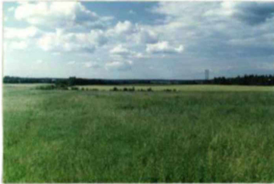
Рис. 3.2. Дослідне поле №1 Південне узбіччя з ловильними пастками.

ранньою весною. Дворядна алея складалася з липи, дуба черешчатого, берези бородавчастої. (Рис.3.2.)