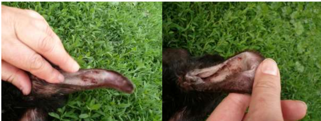
Рис. 1. Вушна раковина, вкрита саднами та подряпинами, за псороптозу кролів

Клінічними обстеженнями інвазованих псороптесами кролів встановлено характерні місцеві ураження вушних раковин. Вони супроводжувалися відвисанням вушних раковин, скуйовдженістю шерстного покриву біля основи вух, больовою реакцією тварини на пальпацію вушних раковин, гіперемією шкіри їх внутрішньої поверхні. Характерним симптомом для всіх інвазованих кролів був сильний свербіж в області вушних раковин. Як наслідок, спостерігали трясіння головою, її нахили в бік ураженого вуха, травмування поверхневих кровоносних капілярів в результаті розчосів та або биття лапою (рис. 1).