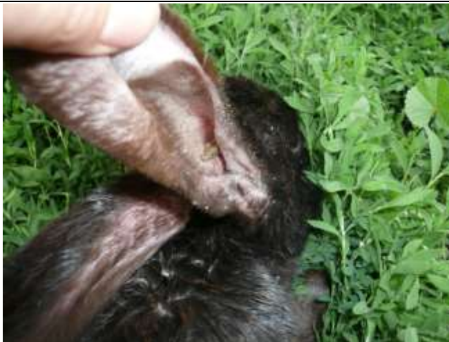
Рис. 2. Закупорений кірочками слуховий прохід вушної раковини та наявність лусочок, струпів навколо основи вушної раковини за псороптозу кролів

Результати наших досліджень свідчать, що до застосування препаратів у двох дослідних групах показники екстенсивності інвазії становили 100 %. Встановлено, що лікувальний вплив місцевих обробок маззю «Ям» проявлявся зменшенням площі ураженої кліщами ділянки шкіри, зникненням гіперемії на 5 добу від початку лікування. Водночас, діагностовано відсутність явищ ексудації, набряку та больової реакції за застосування зовнішньої обробки кролів. Разом з тим, за лабораторного дослідження зіскрібків не виявлено живих кліщів у біоматеріалі на 7 добу спостереження, але виділено поодинокі яйця кліщів у двох дослідних тварин. Вже на 14 добу лікування тварин мазь «Ям» за зовнішнього застосування показала 100 % ефективність. До переваг застосування даного препарату слід віднести його безболісність та екологічність.