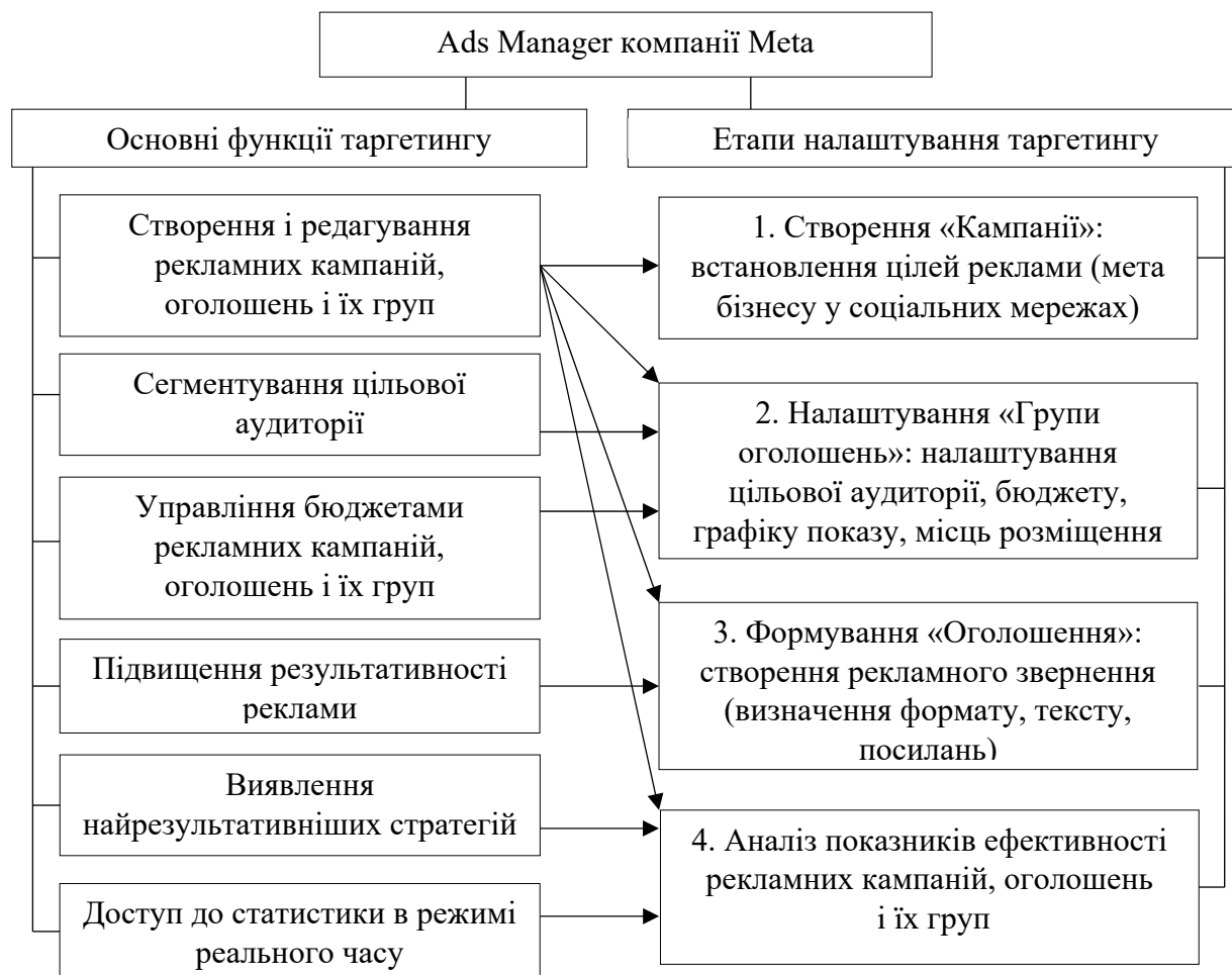
Рис. 1. Основні функції та етапи їх реалізації при налаштуванні таргетингу в Ads Manager