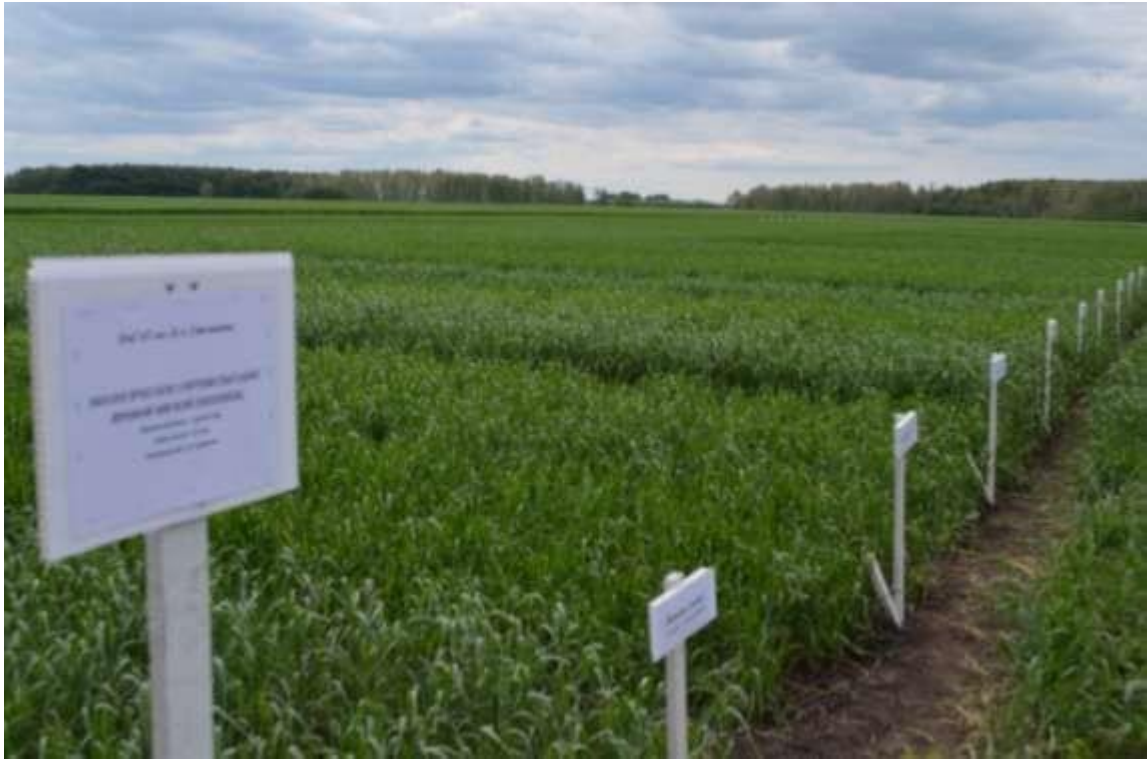
Рис 4. Польові досліді у ТОВ «Савинці», 2024 р.

Дослідження проведено відповідно до методик, викладених у підручниках Б. А. Доспехова (1985); В. Ф. Мойсейченко (1996) та В. М. Лукомець (2010).