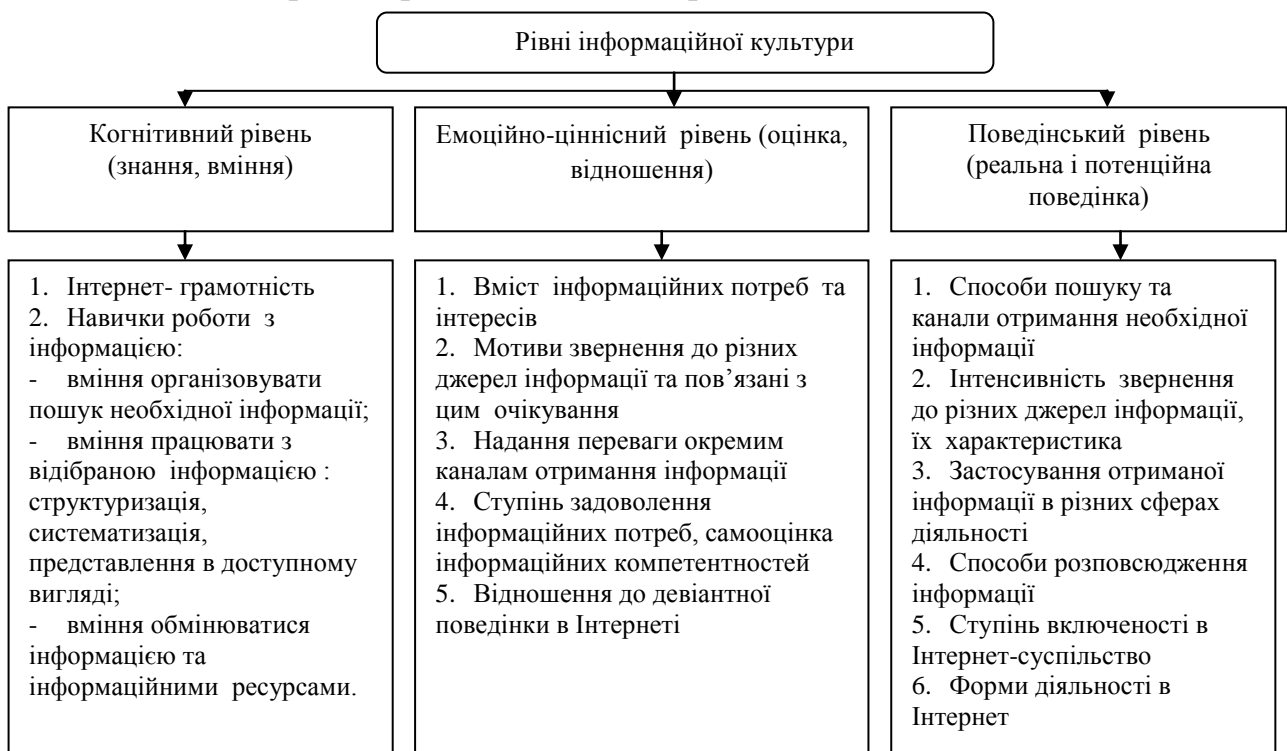
Рис. 2. Рівні інформаційної культури в процесі формування інформаційної безпеки

Рішення проблем забезпечення інформаційної безпеки в контексті інформаційної культури, має носити комплексний системний характер і здійснюватися на різних рівнях останньої (рис. 2).