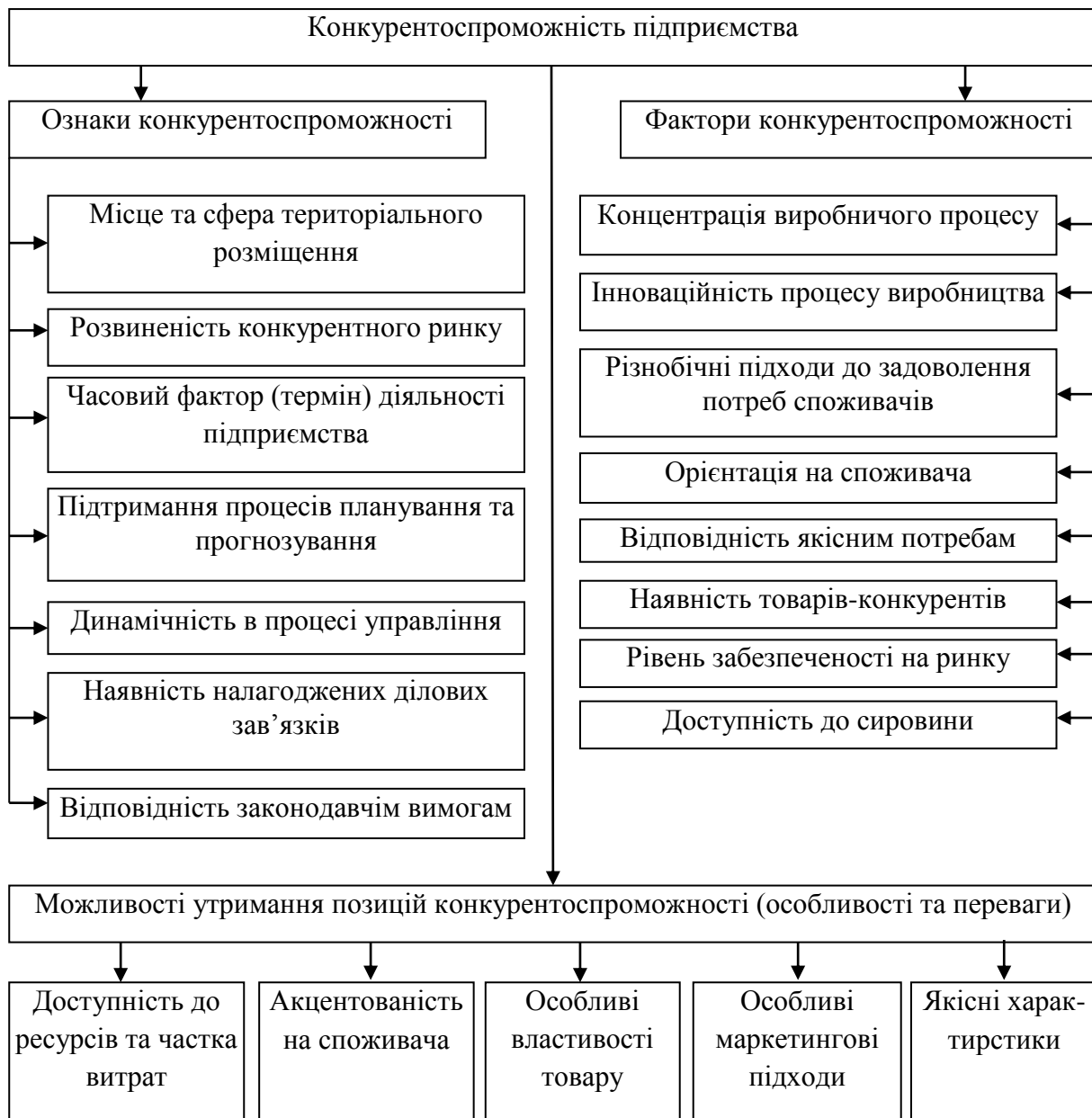
Рис. 2. Характеристики конкурентоспроможності підприємства