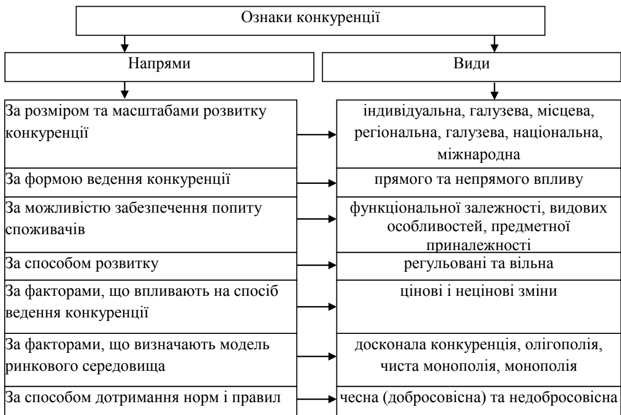
Рис. 1. Ознаки конкуренції та їх характеристики

Велике значення для діяльності комерційної підприємницької організації має, звичайно, конкурентне становище, коли одночасно працюють декілька конкуруючих суб'єктів господарювання, які пропонують однакові, або схожі товари чи послуги. Вивчаючи питання конкуренції, розумієш, що ця категорія є системною, одночасно містить елементи сукупності, різноманітності, специфічності та особливості в кожній окремій ситуації. Узагальнюючою характеристикою є те, що основні складові конкуренції мають мету, має конкретні цілі власного і суспільного характеру одночасно, залежить від характеру ринкового середовища [7]. Тобто, маючи досвід попереднього економічного становища, еволюційних перетворень класифікаційні характеристики визначення конкуренції лише поповнювалися і доповнювалися. Назвемо деякі характерні особливості трактування категорії конкуренції (рис. 1).