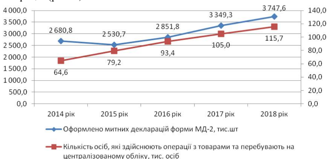
Рисунок 1 – Динаміка суб'єктів ЗЕД та митного декларування товарів [5]

Як показує аналіз статистичних даних Державної фіскальної служби України, за останні роки суттєво зросла кількість суб'єктів зовнішньоекономічної діяльності, відповідно збільшилися обсяги експортно-імпортних операцій (рис. 1).