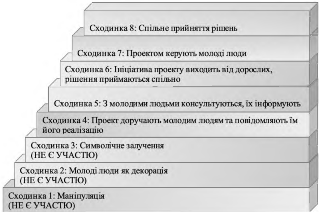
Рис. 1.1. «Сходи участі дітей»

Сходи́нка 5: З молодими людьми консультуються, їх інформують