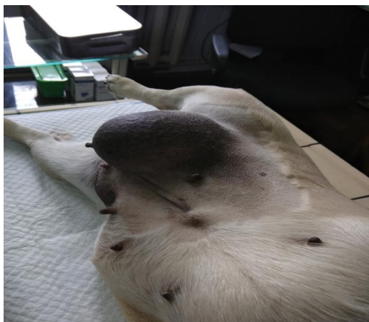
Рис. 2. Пухлина молочної залози у собаки породи мопс

На другому місці за поширеністю знаходиться папіломатоз (18,4 % зареєстрованих патологій тканинного росту). Папіломи виявляли на різних ділянках тіла, найчастіше на вухах, животі, в ділянці рота та очей. Розташовувались папіломи поодинокі чи групами, могли кріпитися тонкою