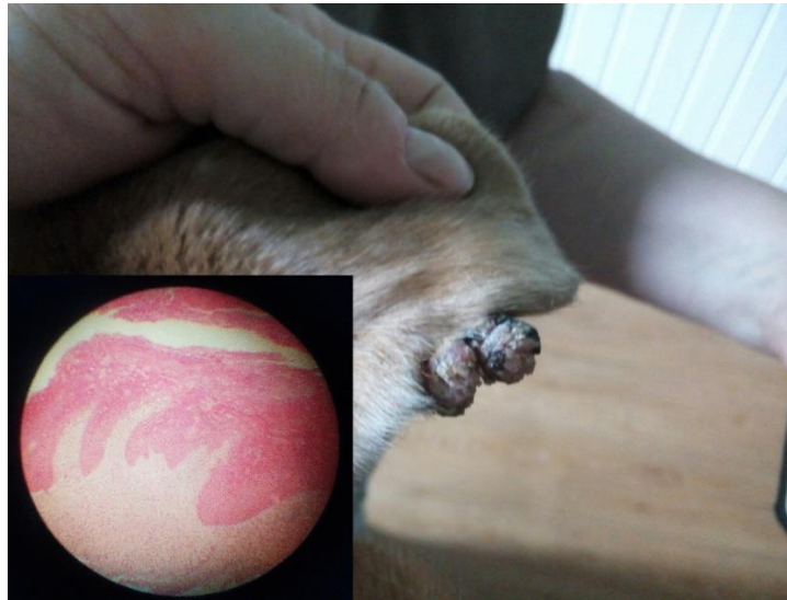
Рис. 3. Папіломи у собаки в ділянці вуха та їх гістологічна картина у збільшенні 7×40, фарбування гематоксиліном та еозином

ніжкою або широкою основою. Поверхня папілом частіше зерниста та нагадує цвітну капусту, але зустрічалися й гладенькі види. Під час мікроскопічного дослідження гістологічних препаратів папілом виявляли, що сосочковий шар шкіри був потовщений, реєстрували значне розростання стріми шкіри, яка зверху вкрита плоским багат шаровим епітелієм.