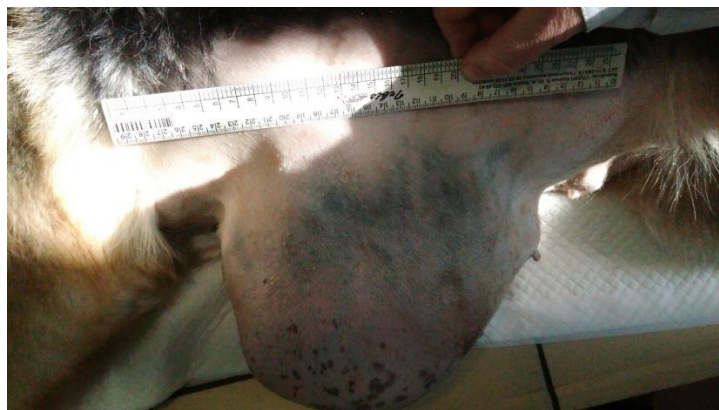
Рис. 1. Пухлина молочної залози у німецької вівчарки

Згідно даних журналів амбулаторного прийому тварин у собак найчастіше були зареєстровані новоутворення молочної залози (21,4 % зареєстрованих випадків), зазвичай, злоякісного характеру. Вони були різного розміру, могли охоплювати один або кілька молочних пакетів (рис. 1, 2).