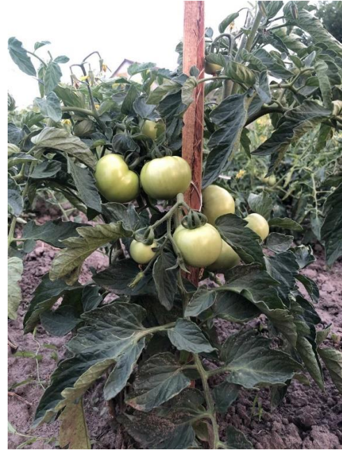
Рис. 2. Колова культура для помідора сорту Етюд