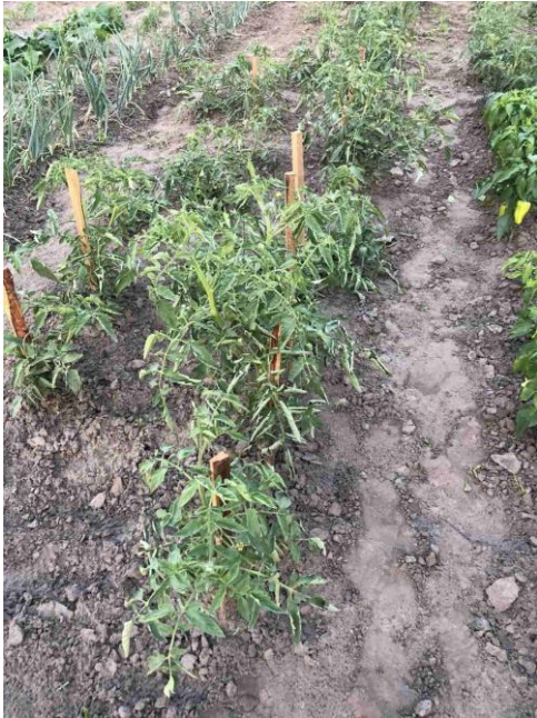
Рис. 1. Догляд за помідорами методами органічного землеробства

У період вегетації догляд за рослинами полягав у систематичному розпушуванні міжрядь, виконанні бур'янів у рядках і поливах (рис. 1). Після утворення плодів стебло вилягає. Тому для помідорів була застосована колова культура (рис. 2).