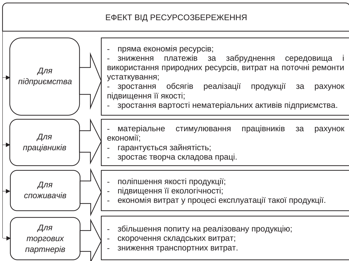
Рис. 3. Ефект від ресурсозбереження для суб'єктів-господарювання