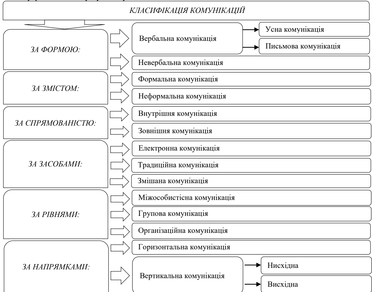
Рис. 1. Класифікація комунікацій [узагальнено за допомогою 4]

Комунікації на підприємстві відіграють ключову роль у процесі формування та розвитку організаційної культури, вони впливають на те, як працівники взаємодіють, обмінюються інформацією та спільно вирішують проблеми. Організаційна культура завжди була і буде унікальною характеристикою підприємства внаслідок існування множини її автентичних характеристик та особливостей прояву [5]. Її формування часто починається з моменту виникнення бізнес-ідеї, а розвиток і постійна трансформація – з моменту фактичного запуску бізнесу.