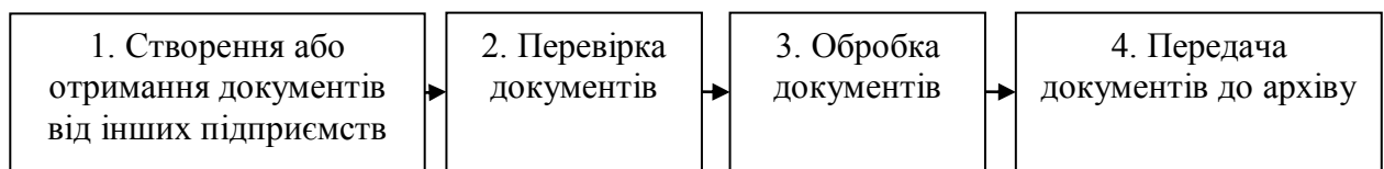
Рисунок 2 – Стадії документообігу

Організація руху документів, пов'язаних з веденням бухгалтерського обліку на підприємстві є важливою складовою його діяльності. Від ефективності зазначеного процесу залежить якість управління підприємством, швидкість і точність прийняття управлінських рішень (рис. 2).