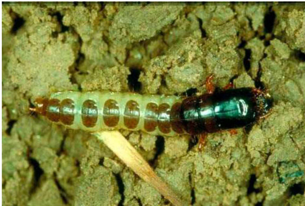
Рис.2.2. Личинка хлібного туруна

Личинки до 28 мм. Має три віки, які відрізняються за розмірами головної капсули й тіла (Рис 2.2).