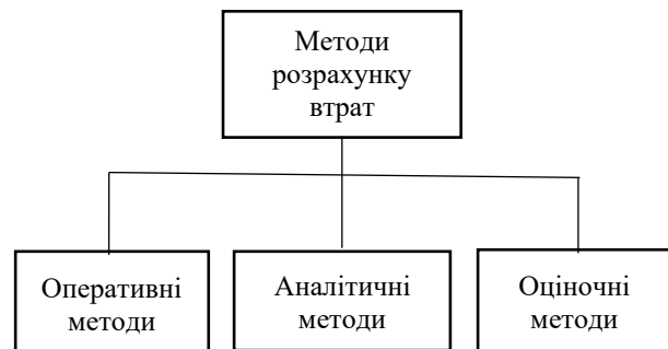
Рисунок 1 – Розрахунок втрат навантаження електричної енергії

Оціночні методи базуються на використанні ймовірнісних характеристик та узагальненої інформації.