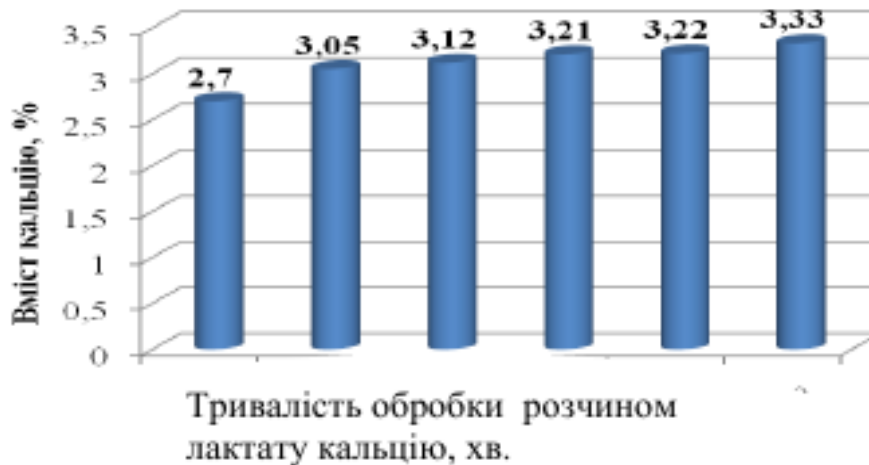
Рис. 2. - Вплив тривалості обробки рубця лактатом кальцію на ступінь зв'язування іонів кальцію

Досліджували також тривалість кальцинування, адже при визначенні концентрації розчину вимірювання проводилися кожні 2 години. А можливо максимальне зв'язування іонів кальцію настає раніше. Результати наведено на рис.2.