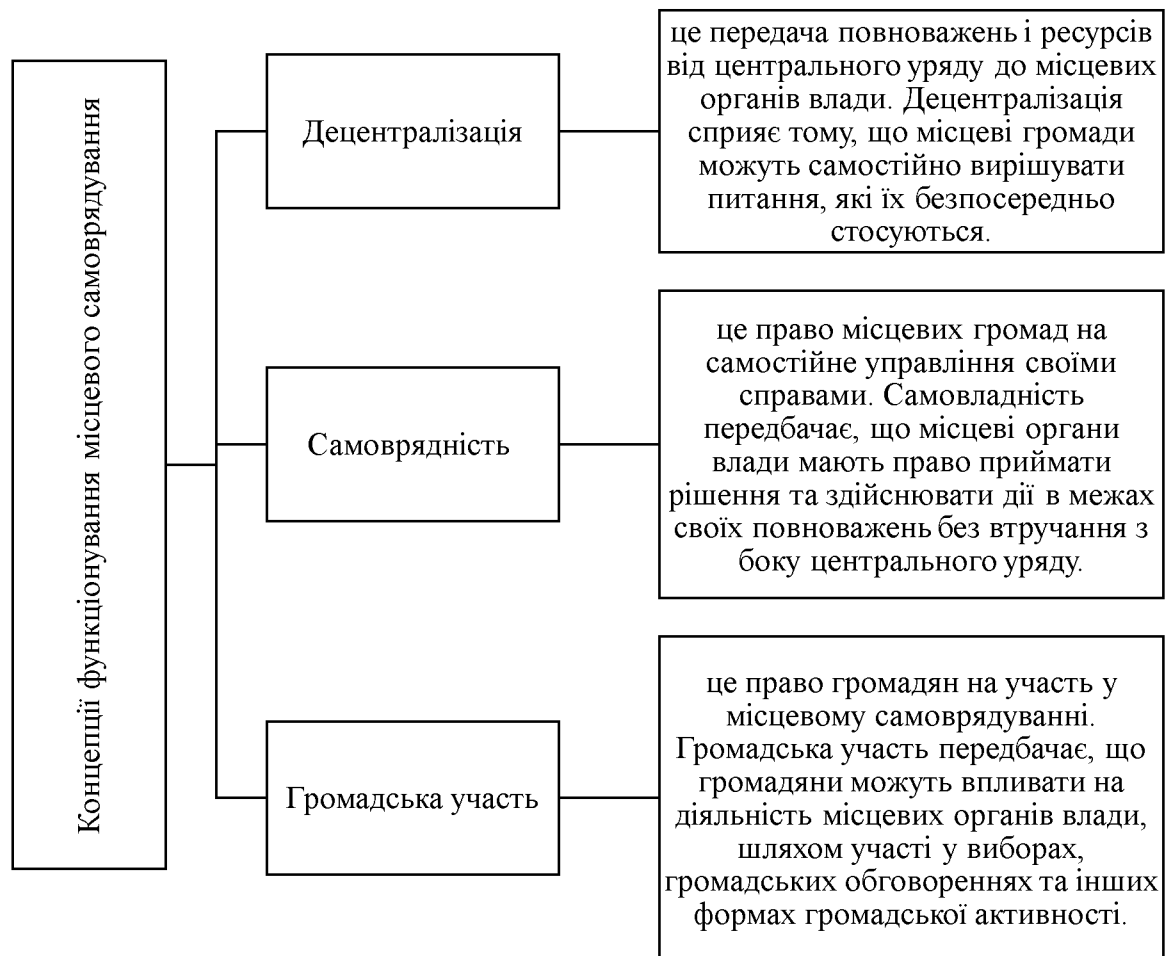
Рис.1.2. Концепції функціонування МС [23, с. 62].

Основні концепції функціонування місцевого самоврядування відображено у праці М.Є. Василенко (рис. 1.1).