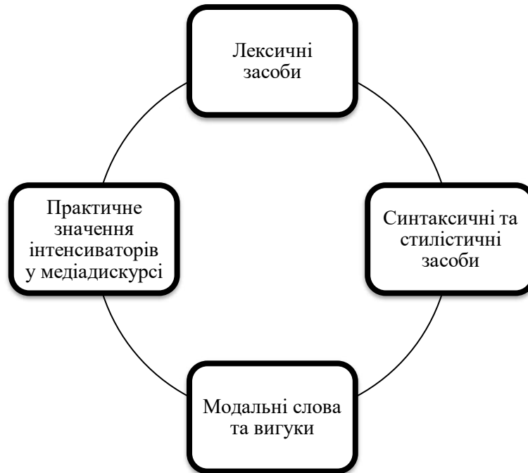
Рис. 2.2. Форми вербальних інтенсиваторів

засоби, синтаксичні конструкції, модальні слова, прислівники, повтори, вигуки та експресивні вставки (рис. 2.2).