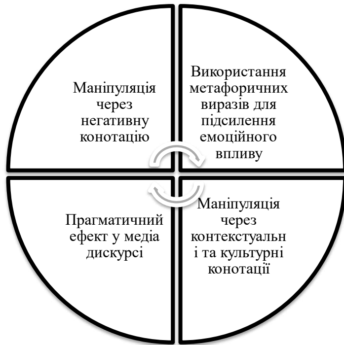
Рис. 2.1. Способи емоційного впливу медіа засобами фразеологізмів а ідіом

1. Маніпуляція через негативну конотацію. Ідіоми з негативним забарвленням, наприклад, a wolf in sheep's clothing («вовк у овечій шкурі») або to play dirty («грати брудно»), часто застосовуються в політичних і соціальних матеріалах. Вони дозволяють автору передати негативну оцінку дій персонажів або груп без прямого коментаря. Такий підхід створює у читача відчуття недовіри, настороженості або навіть обурення, водночас залишаючи текст об'єктивним з погляду журналістської етики.