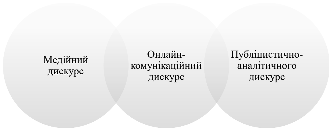
Рис. 3.2. Типи текстів для порівняльного аналізу

емоційних висловлювань, що дозволяє провести комплексний лінгвістичний аналіз.