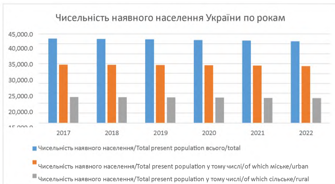
Рис. 1.2. Чисельність наявного населення України по рокам

Продемонструємо динаміку зміни наявного населення України за допомогою діаграми.