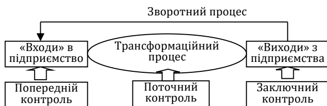
Рис. 1. Види управлінського контролю [4]

Розрізняють наступні види управлінського контролю: попередній, поточний та заключний (рис. 1).