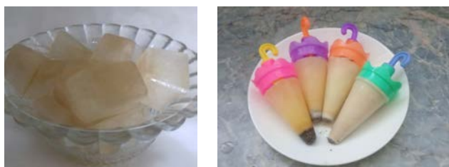
Рис. 1. Зразки замороженого соку сирі картоплі (а – без добавок, б – з маковим молочком)

Заморожений картопляний сік. Зразки картопляного соку, виготовленого за способом 1 і способом 2, розміщували в ємності місткістю 10 мл, заморозували в камері холодильника за температури -18^\circ\text{C} протягом 24 год. Після завершення заморозування виймали з ємностей і використовували для досліджень (рис. 1а). До зразків картопляного соку додавали макове молочко в кількості 10, 20, 30, 40% і заморозували у формі для морозива (рис. 1б).