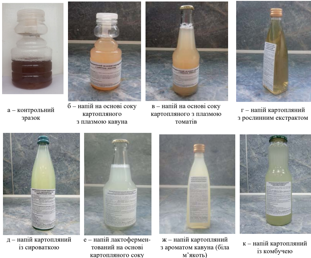
а – контрольний зразок

Ідея купажування картопляного соку була ефективно реалізована з виноградним соком у пропорції 10 та 30% (Basílio et. al., 2022). У дослідженнях було виявлено підвищений вміст біологічно активних сполук та низькі рівні небажаних амінів, що свідчило про безпеку споживання купажованих напоїв