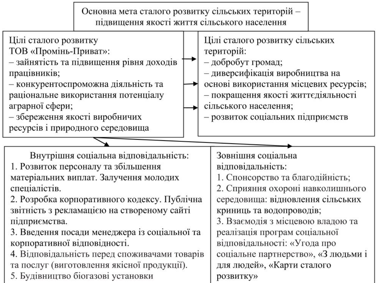
Рис. 3.1. Функціональний зв'язок соціальної відповідальності ТОВ «Хххххххххххххх» та сталого розвитку територій, 2022-2026 рр.

функціональна (підсистеми забезпечують реалізацію спільних узгоджених цілей); організаційна (підсистеми мають перебувати в логічному сполученні); ресурсна (підсистеми функціонують за рахунок однакових ресурсів). Функціональний зв'язок ТОВ «Хххххххххххххх» і розвитку підприємства наведено на рис. 3.1.