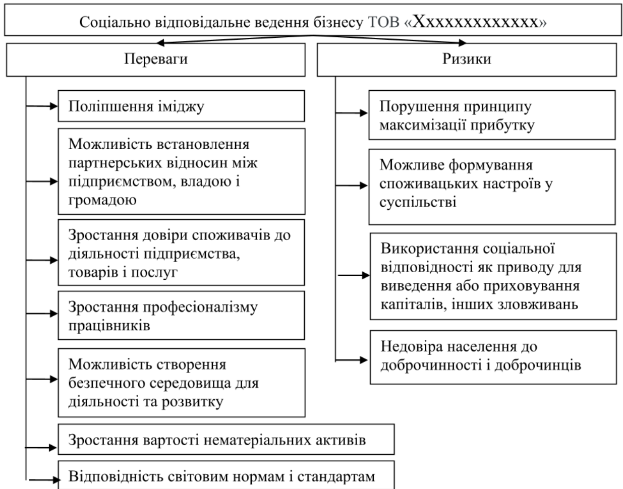
Рис. 3.4. Переваги та недоліки впровадження соціально відповідального ведення бізнесу ТОВ «Хххххххххххххххх», 2022 р.

Реалізація соціально відповідального ведення бізнесу ТОВ «Хххххххххххххххх» в довгостроковому періоді поліпшить моральний клімат колективу в підприємстві, покращить його ділову репутацію, забезпечить формування корпоративної культури, зростання конкурентоспроможності та капіталізації, сприятиме підвищенню інвестиційної привабливості підприємства як серед місцевої громади, так і в цілому в Миргородському регіоні. Сільським громадам та органам місцевого самоврядування доцільно мати дієві інструменти впливу на господарюючі суб'єкти для захисту інтересів членів громад.