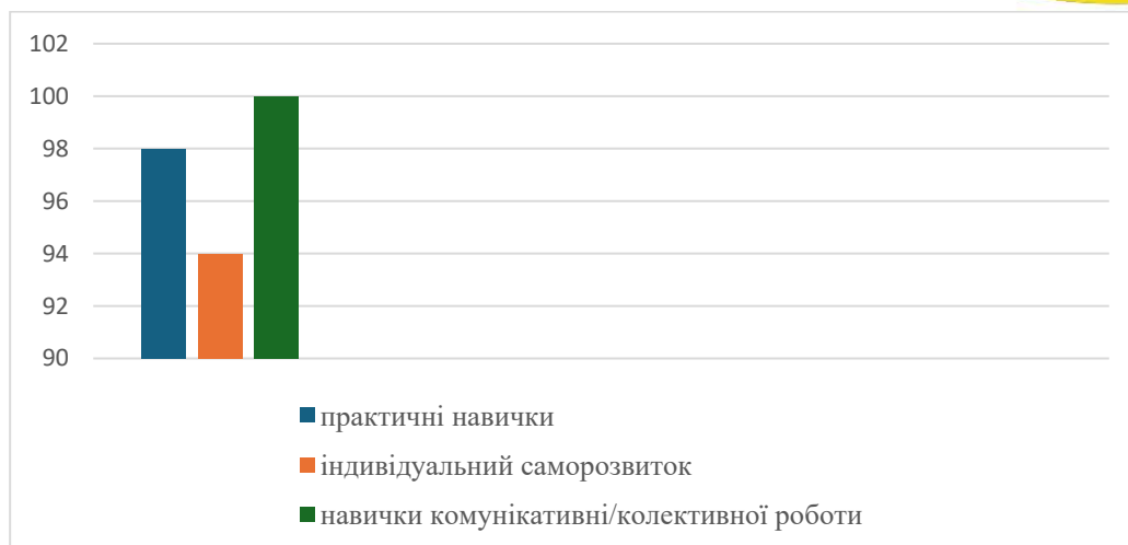
Гістограма 1. Переваги командної гри: думка здобувачів вищої освіти

Здобувачам вищої освіти також було запропоновано оцінити ефективність командної гри як форми самостійної роботи від 1 до 5 балів, де 1 – найнижчий бал, 5 – найвищий. Результати представлені на гістограмі 2: 60% оцінили на 5 балів, 30% – на 4 бали, 8% – на 3 бали, 2% – на 1 бал (гістограма 2).