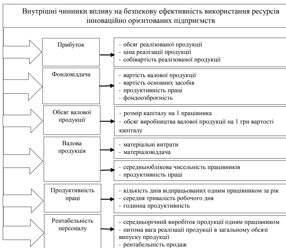
Рис. 1. Внутрішні чинники впливу на безпекову ефективність використання ресурсів інноваційно орієнтованих підприємств