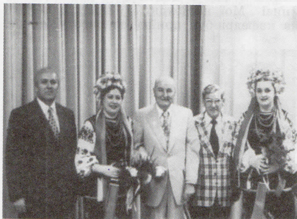
Делегацію з України приймає мер м. Ріджайна (1977 р., Канада). А красуні ж – полтавські...