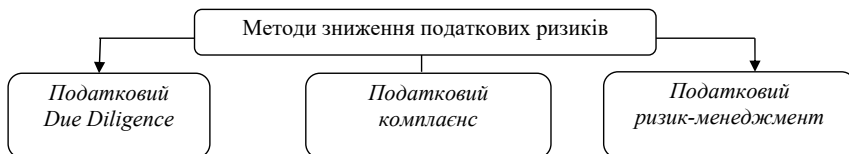
Рис. 2. Основні методи зниження податкових ризиків

Відтак, загрози – це передумови виникнення ризиків. Основна відмінність між даними поняттями полягає в тому, що ризики є ймовірними, тоді як загрози – це можливі небезпеки, які під впливом чинників сприяють настанню ризиків, і як наслідок – виникнення фінансових втрат як для суб'єктів господарювання, так і держави. Тому податкова безпека має ґрунтуватися на використанні сучасних методів зниження податкових ризиків. Основні з яких наведено на рис. 2.