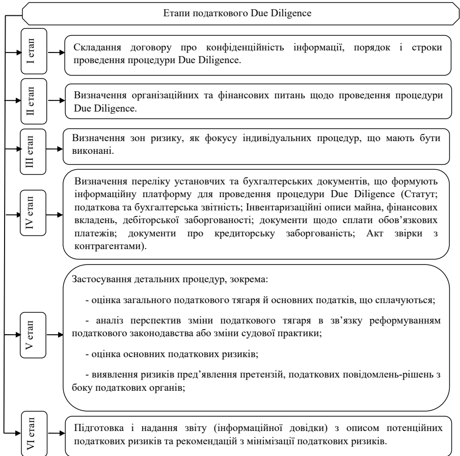
Рис. 3. Основні етапи податкового Due Diligence

Основні етапи податкового Due Diligence наведено на рис. 3.