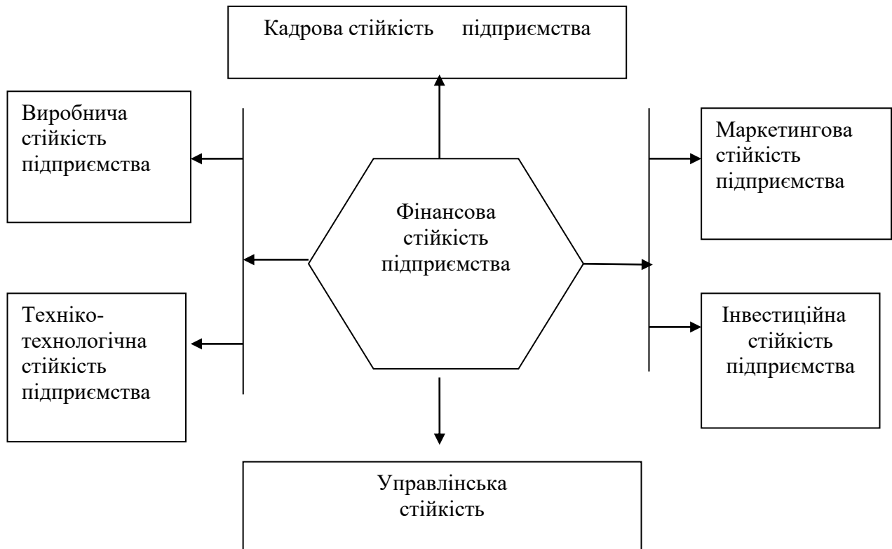
Рис.1.1. Складові фінансової стійкості підприємства