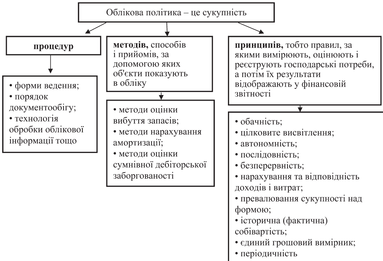
Рис. 2. Складові облікової політики ПП «Імені Калашника» (розробка автора)

У розділі I пасиву балансу не міститься сум за від'ємними статтями пасиву: неоплачений капітал, вилучений капітал; збільшилася залежність підприємства від довгострокових і поточних зобов'язань і забезпечень; поточна кредиторська заборгованість збільшилася на 176,5 %. Підвищення її частки в джерелах формування капіталу з