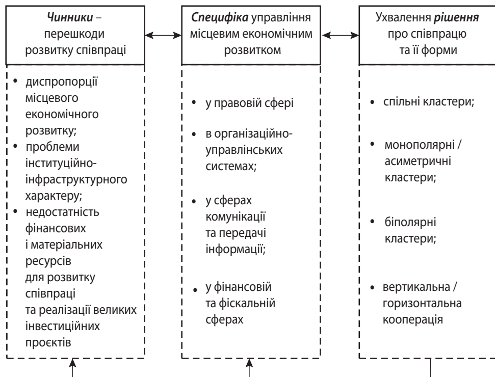
Рис. 1. Чинники та особливості формування, форми міжмуниципальної співпраці з розвитку кластерів

До них належать не лише суб'єкти бізнесу й органи місцевого самоврядування та регіонального розвитку, але й місцеве населення, яке зацікавлене в процесах макроекономічного розвитку, надходження в громаду інвестицій, поліпшення її економічної й інвестиційної привабливості як ключових передумов