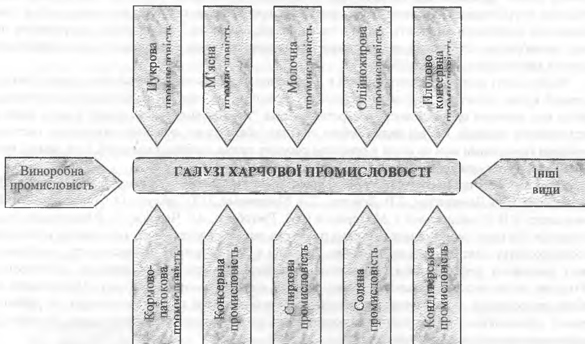
Рис. 1. Галузі харчової промисловості

Ця група представлена хлібопекарською, кондитерською, макаронною, пивоварною, молочною галузями. Галузі з одночасною орієнтацією на сировину і споживача (при більшій масі сировини порівняно з готовою продукцією) – це борошномельно-круп'яна, м'ясна, виноробна, поттонова, лікеро-горілчана [7]. На нашу думку, провідними галузями харчової промисловості є 12 галузей (рис. 1):